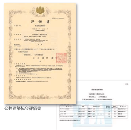
公共建築協会評価書