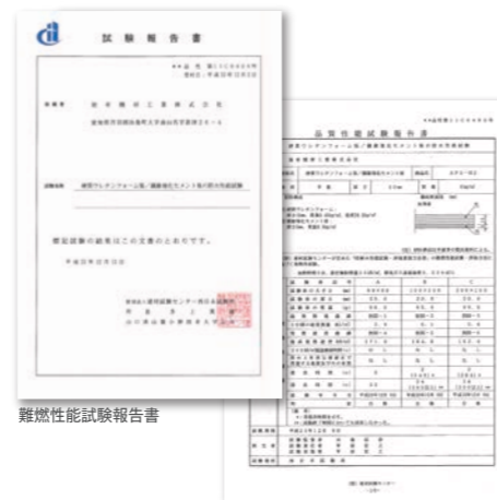
難燃性能試験報告書